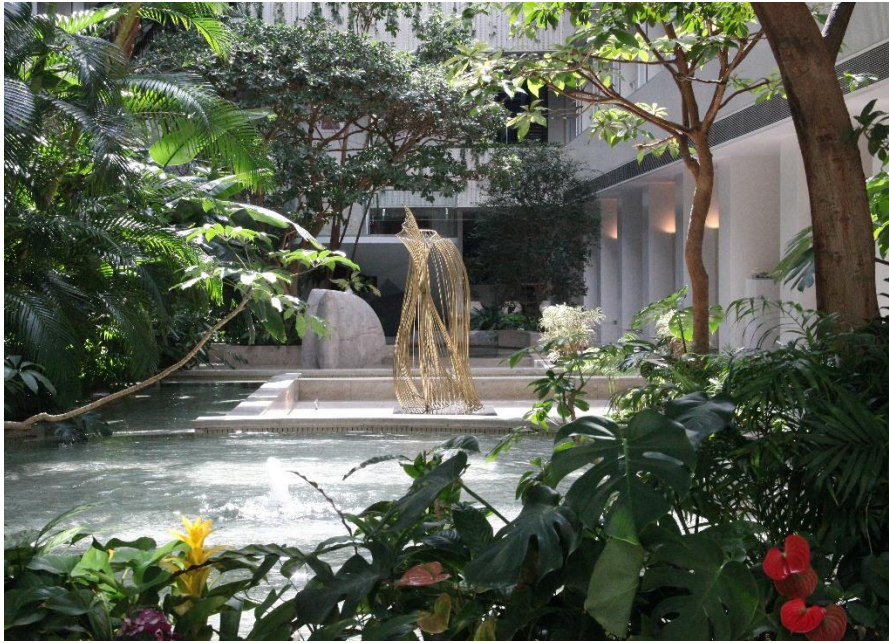
鹿島KIビル アトリウム

「KAJIMA 彫刻コンクール」は今回で第18回を迎えることになりました。 「彫刻・建築・空間」をテーマに、彫刻芸術と建築空間が会う新しい空間の創造を目指しております。 彫刻作品の設置によって、建築がつくり出す空間が活性化し、より魅力的なスペースを創出することを願っています。 彫刻が生み出す緊張感・生命感あふれる空間を、都市に、人々に…… 皆様からの意欲的な作品のご応募を期待しています。