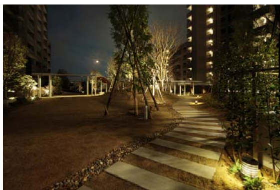
▲サンクス・ガーデンの散策路（夜景）