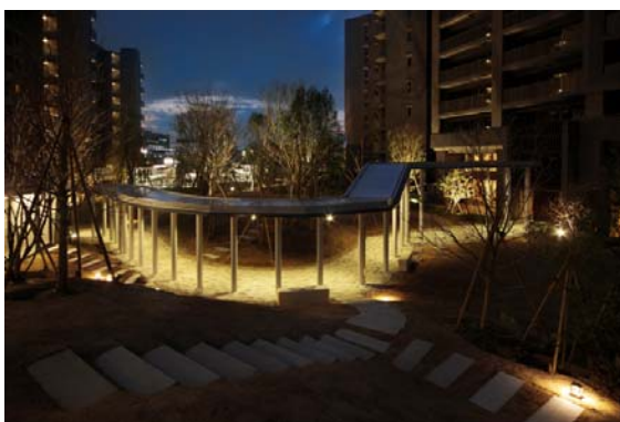
▲サンクス・ガーデン渡り廊下（夜景）