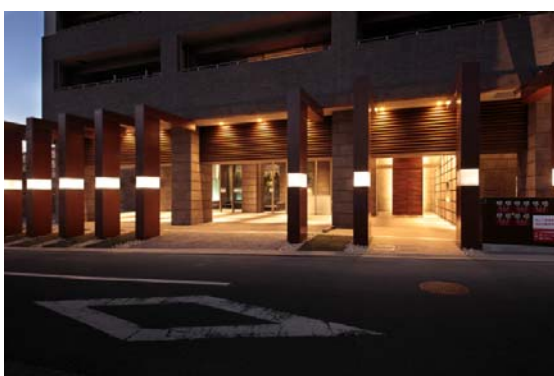
▲サザン・レジデンス グランドエントランス