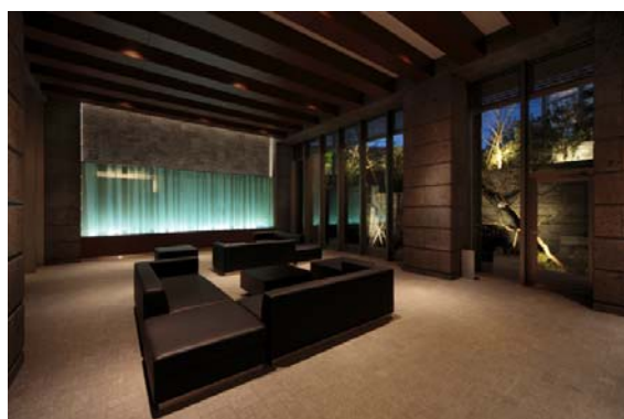
▲サザン・レジデンス グランドエントランス・ラウンジ