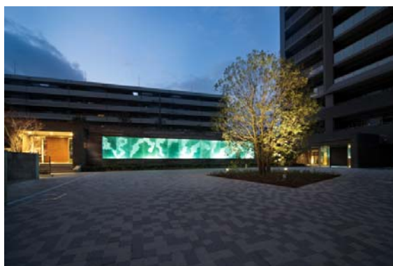
▲ノーザン・レジデンスへのアプローチ（薄暮景）