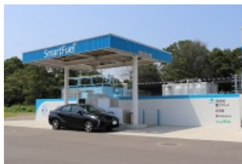
しかおい水素ファーム®の水素ステーション