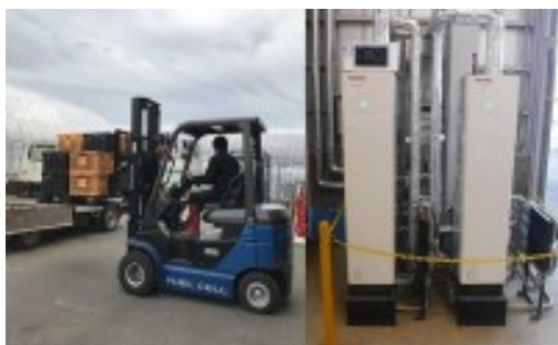
燃料電池フォークリフト（左）と環境保全センター内に設置した燃料電池