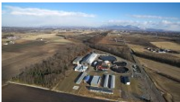
鹿追町環境保全センター中鹿追バイオガスプラント全景