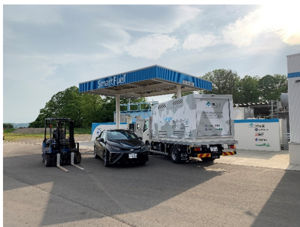
当事業関係車両3両と水素ステーション