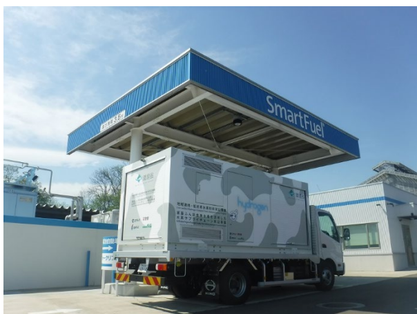
簡易型水素充填車

帯広市内・鹿追町内の農業倉庫にて FC フォークリフトへの水素供給を行うほか、帯広市内においては、寒冷地での水素利用設備の導入を目指し、非常時の電力ニーズにも対応した水素吸蔵合金・燃料電池利用システムの実証を行う予定です。これらの取り組みを通じて、水素の普及展開への貢献を図りたいと考えております。