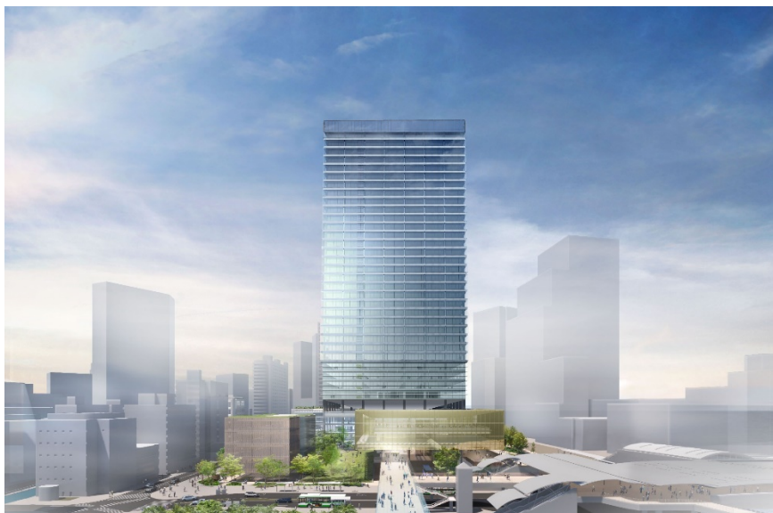
複合施設 A 全体外観（東側）