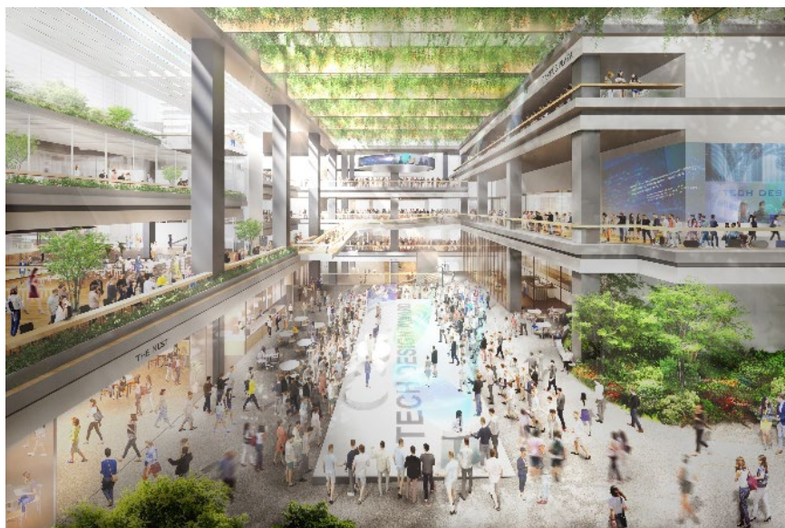
複合施設 A 低層部内観

※完成予想イメージは計画段階のものであり、今後の協議などにより変更となる可能性があります。