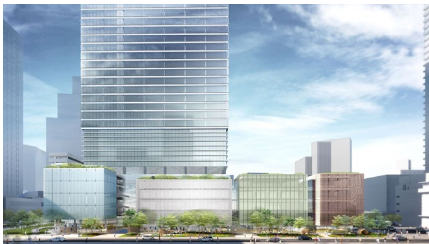
複合施設 A 低層部外観（南側）