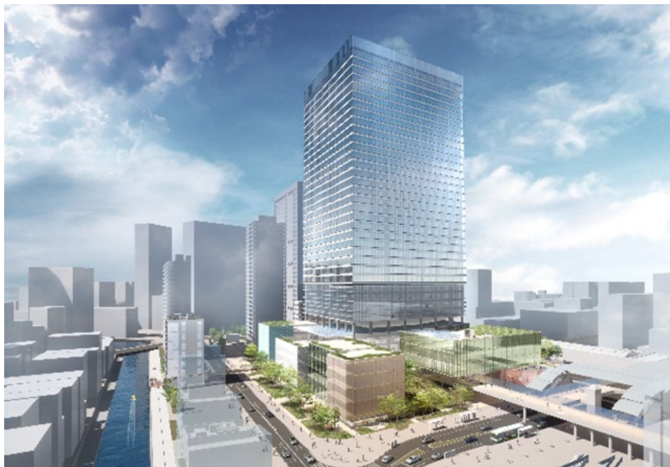
複合施設 A・複合施設 B（完成予想イメージ）

今後は、東京工業大学と連携を図り、工業デザイン発祥の地である本事業敷地において、国内外の企業・大学が集積する産業・研究拠点の整備を行うとともに、新たな都市像となる「イノベーション・ウォーターフロント」の実現に向けて、田町エリアの街づくりを推進してまいります。