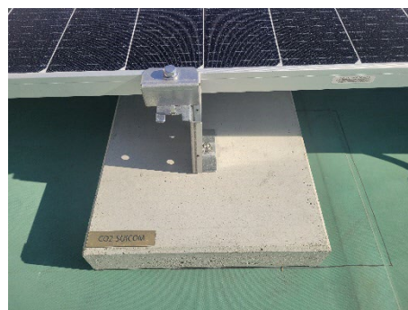
横浜市立元街小学校に導入した太陽光発電設備と CO 2 -SUICOM

今後、東京ガス、鹿島及び日コンは、本製品の大量生産及びコストダウンに向けた開発を継続し、本製品の普及拡大を通じて、日本国内の CO 2 排出総量の削減及び脱炭素社会の実現に貢献してまいります。また、横浜市は 2050 年の Zero Carbon Yokohama の達成に向けて、引き続き、脱炭素化に資する先進技術の導入について検討してまいります。