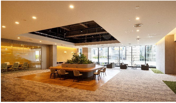
入居者専用のワーカーズラウンジ