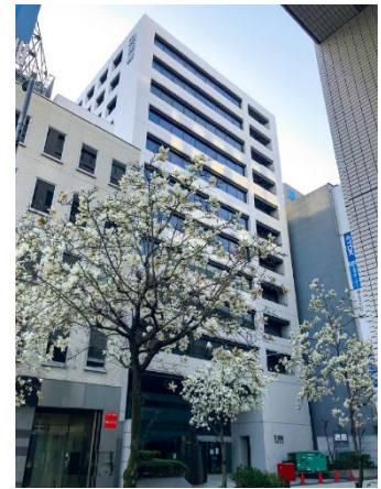
旧鹿島中部支店ビル

栄トリッドスクエアの敷地の一部は、当社が長きにわたり中部支店として拠点を構えてきた土地です。老朽化が進んでいた同ビルの有効活用として、同じく古くからこの地でビルを所有してきた第一生命およびノリタケと共に、地域に根差した計画をすべく、2020 年より検討を進めてきました。各企業の敷地を一体化しての共同開発事業によって、個別土地では難しかった高度利用により価値最大化を図りつつ、公開空地の整備などを通して、地域の魅力向上に寄与する計画を実現しました。