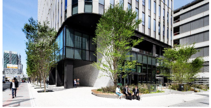
賑わい創出や回遊性向上を企図した公開空地