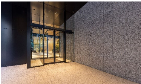
アップサイクル素材のテラゾを使用した外壁部分