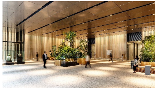
オールドノリタケなどを展示しているエントランスロビー