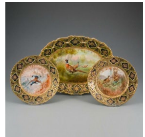
展示されているオールドノリタケ