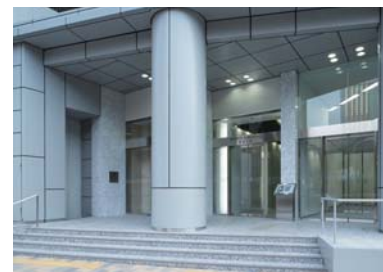
オフィスエントランス