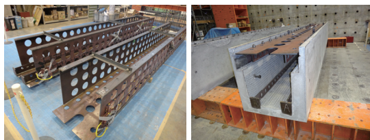
孔あき鋼板ジベルを用いたハーフプレキャストSC梁部材 Half Precast SC Beam Using Perfobond Rib Shear Connectors

曲げ耐力及びせん断耐力の確認のために2体の載荷実験を実施した結果、曲げ耐力、せん断耐力ともに鋼材を鉄筋に置き換えることにより、RC部材と同様の手法により、耐力を評価できることを確認した。次に、さらなる現場作業の効率化を考え、型枠作業の省略が可能なハーフプレキャストのSC部材を考案した。この部材についても梁試験体を用いて載荷実験を行い、耐力力及びハーフプレキャスト部材と後打ちコンクリートとの一体性を確認した。