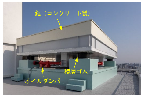
福岡フジランドビルの屋上に設置された D 3 SKY-c