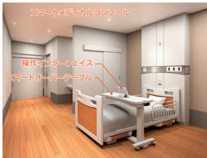
NEM-AMOREを組み込んだ病室のデザイン例 Design Example of Hospital Room with NEM-AMORE

「NEM-AMORE」は、センサで得た「患者の体の状態」と「病室内の音・光・熱環境の情報」を統合し、自動且つ無意識に1日の生体リズムを整えることで、入院患者の睡眠環境を最適化する技術である。考案した睡眠環境制御アルゴリズムは、患者の入眠を検知し眠りの状態を測る“生体センサ”の情報と、病室内の温湿度・騒音・照度を測定する“環境センサ”の情報を統合し、患者の起床から就寝までの一日の生活リズムに合わせた室内環境をつくるプログラムである。この睡眠環境制御アルゴリズムと、睡眠環境向上エビデンスに基づき、患者に意識させることなく病室内の環境を制御することで、睡眠に与える影響力の大きい「温熱」・「音」・「光」環境が自動で最適化され、入院する患者個々の睡眠の質が向上する。本技術の一部は、あけぼの病院、座間総合病院、西能病院ほかに導入された。