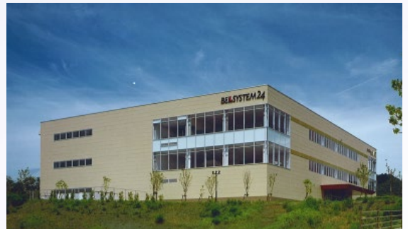
公有地の活用実施例※（島根県 コールセンター）

※上記実施例は、進出企業様が自治体様から土地を借地のうえ、鹿島リースが転賃を受ける仕組みとなっております。