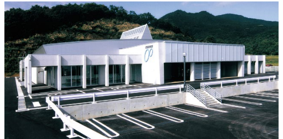
公営施設整備実施例（新潟県妙高市 場外車券場）