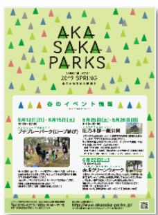
港区赤坂地区公園便り (年4回発行)